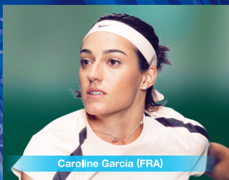
Caroline Garcia (FRA)