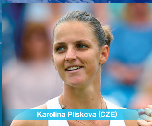
Karolina Pliskova (CZE)