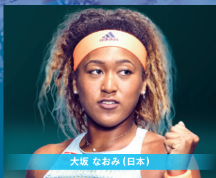
大坂 なおみ (日本)