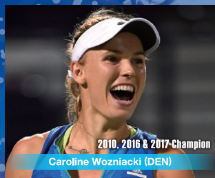
2010、2016 & 2017 Champion Caroline Wozniacki (DEN)