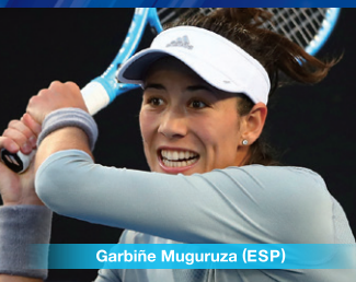
Garbiñe Muguruza (ESP)